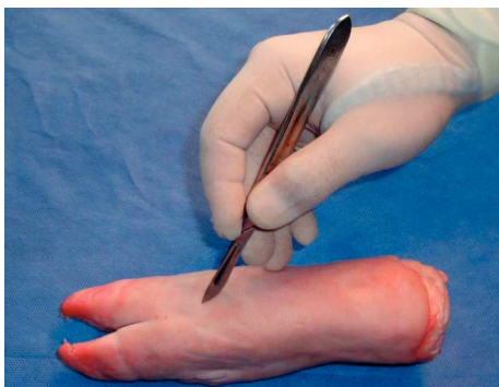
Figura 1 Realización de incisiones para simular herida cortante.

Para realizar el procedimiento es necesario emplear guantes y gasas estériles, cubrebocas, jeringas de insulina y de 5 ml, solución salina, clorhexidina, yodopovidona, lidocaína simple al 1% y un riñón metálico. Se procede al lavado por arrastre con abundante solución salina (figura 3), luego se realiza anestesia local mediante infiltración de lidocaína subcutánea con la técnica de infiltración de campo (figura 4); este paso puede ser previo al lavado por arrastre, para lo cual antes se hace antisepsia de los bordes de la herida con yodopovidona. Se continua con el lavado de