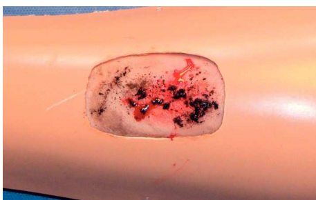
Figura 2 Modelo con maquillaje y detritos montado en molde.

la herida con una gasa estéril empapada con clorhexidina del centro a la periferia, y por último se realiza antisepsia con yodopovidona del mismo modo (figura 5), se desbrida el tejido en caso necesario, se quita el excedente con suficiente solución salina, se seca con una gasa estéril, se realiza cierre de la herida mediante sutura con puntos simples y se cubre la herida con un parche estéril.