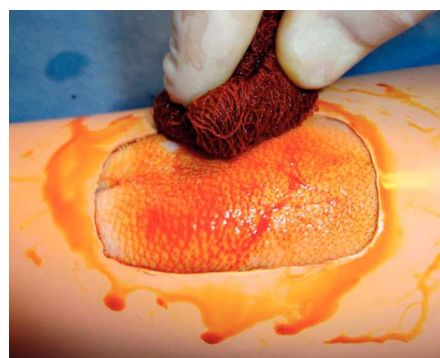
Figura 5 Antisepsia de la herida con yodopovidona.