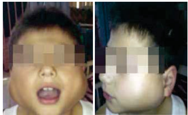
Figura 1 Presencia de 2 masas en cuello en regiones parotídeas izquierda y derecha, de 10 x 7 y 8 x 6 cm, respectivamente, las cuales eran no móviles, no dolorosas y de consistencia dura.

A su ingreso al Servicio de Urgencias, se atiende a un niño de 33 Kg (percentil 75) con un buen estado general de salud. Signos vitales: taquicárdico, sin dificultad respiratoria y afebril. A la exploración física, destaca la presencia de 2 masas en cuello en regiones parotídeas izquierda y derecha, con hematomas en sus porciones inferiores que medían aproximadamente 10 x 7 cm y 8 x 6 cm, respectivamente, las cuales eran no móviles, no dolorosas y de consistencia dura. Se detectaron además 2 adenomegalias submaxilares de 3 cm de diámetro, una supraclavicular izquierda de 2 cm y una inguinal derecha de 4 cm, la cual era dolorosa a la palpación. A la exploración abdominal, se palpó el hígado 3-4 cm y el polo esplénico a 2 cm, por debajo del reborde costal. El resto de exploración física fue normal (fig. 1).