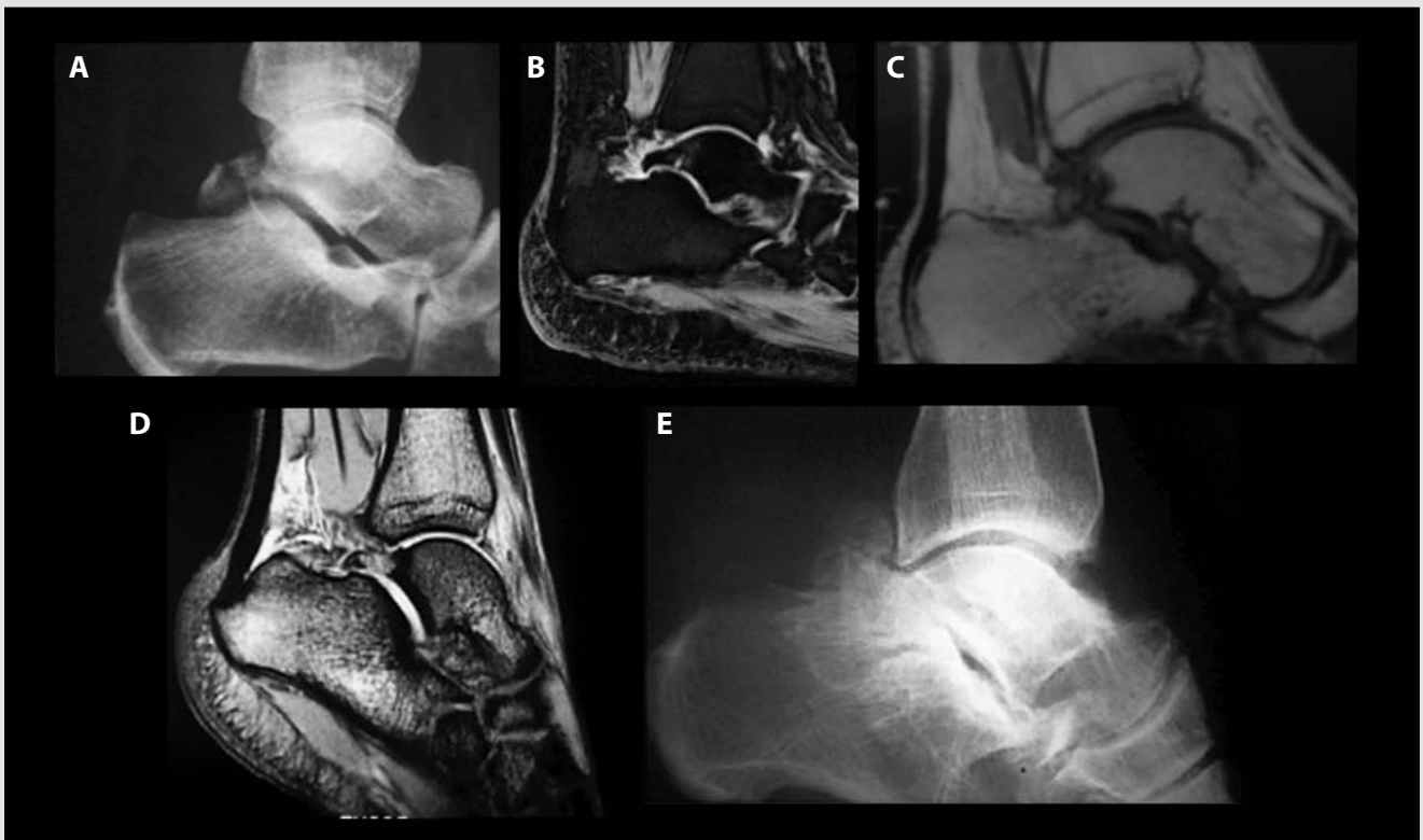
Figura 2. A) Fractura de Cloquet-Shepherd. B) Fractura oculta. C) Os trigonum con edema óseo postraumático. D) Necrosis con fractura por sobrecarga. E) Cola hipertrófica, artrosis y cuerpo libre.

vidad física, muchas veces con el antecedente de una entorsis o microtraumatismos repetidos durante la actividad deportiva.