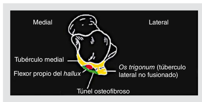
Figura 1. Esquema de la anatomía de la cola del astrágalo.

El síndrome de la cola del astrágalo se produce por un mecanismo lesional de flexión plantar forzada del tobillo. En esta situación, la cola del astrágalo y las