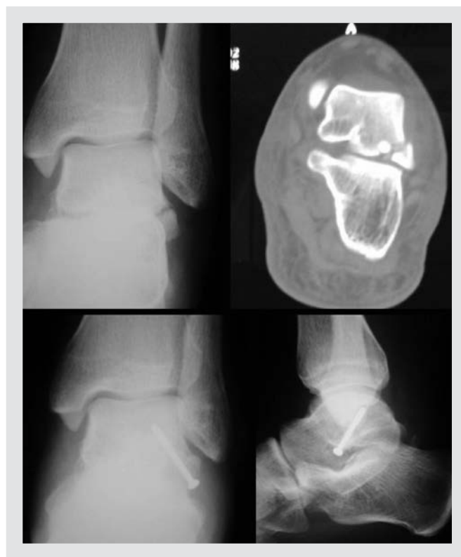
Figura 2. Radiografía y tomografía computarizada de fractura de la apófisis lateral del astrágalo y radiografías postoperatorias de la osteosíntesis realizada.

Clínicamente presentan dolor en la zona medial del mesopié, inmediatamente distal y anterior al maléolo