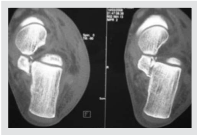
Figura 3. Imagen de tomografía computarizada de fractura de sustentaculum tali .