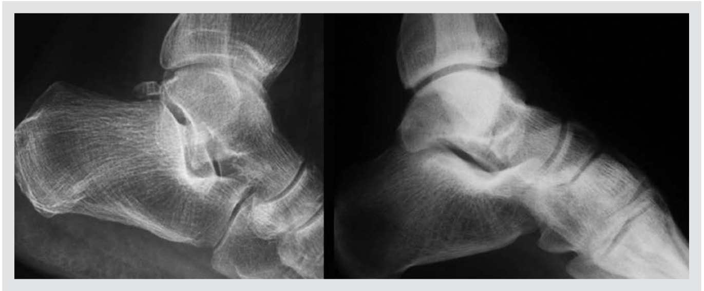
Figura 1. Visualización de la forma de “V itálica” simétrica de la apófisis lateral y “signo de la V positiva” en un caso de fractura.

dorsiflexión, un 80% de rotación externa y un 45% de eversión.