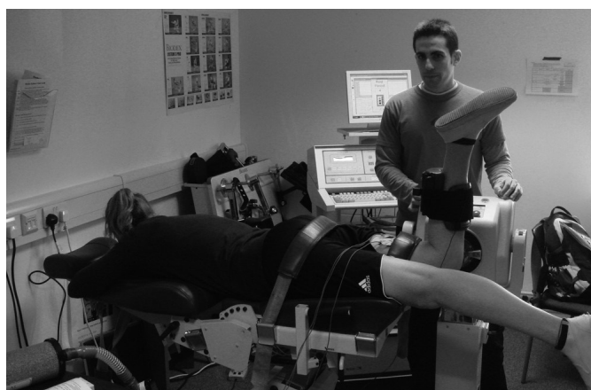
Fig. 2. Posición de valoración en decúbito prono con cadera fijada a 0^\circ de flexión y cabeza en posición neutra.

En cada sesión experimental, únicamente la pierna dominante fue evaluada 54 . Todos los participantes adoptaron como posición de valoración la de decúbito prono sobre la camilla del dinamómetro con cadera fijada a 0^\circ de flexión y cabeza en posición neutra (fig. 2) 55,56 . La posición de tendido prono ( 0^\circ de flexión de cadera) fue seleccionada en lugar de la extensivamente utilizada posición de sentado ( 80-110^\circ de flexión de cadera) por dos razones principales: