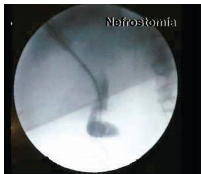
Figura 3 Presencia de sonda de nefrostomía (sonda Foley), a través del cáliz medio. Se observa cáliz superior, medio, pelvis renal y tercio superior de uréter.

No se recibió patrocinio para llevar a cabo este artículo.