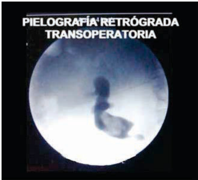
Figura 1 Pielografía retrógrada de riñón en herradura. Paciente en posición prono. Se observa tercio superior de uréter, cáliz superior, medio e inferior, presencia de defecto de llenado piélico producido por un cálculo de 2 cm aproximadamente.

se programa para cirugía percutánea según la técnica descrita previamente. Se aborda colector medio con tracto único (fig. 2).